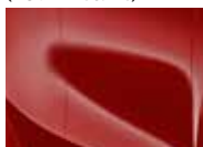
Track Red (FRD – Solid)