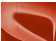
Orange Fusion (RNG – Metallic)