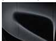
Black Pearl (1K – Metallic)