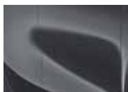
Penta Metal (H8G – Metallic)