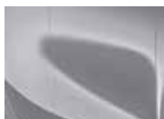
Sparkling Silver (KCS – Metallic)