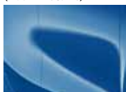
Blue Flame (B3L – Metallic)