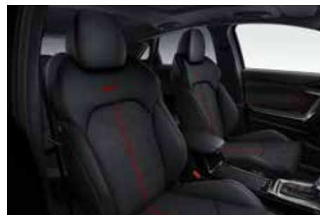
Sitzbezüge Leder (Suede) mit GT-Logo