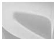
Deluxe White (HW2 – Metallic)