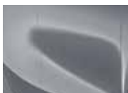
Lunar Silver (CSS – Metallic)