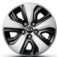
16" Leichtmetall Felgen (Style) Jantes en alliage léger 16" (Style) Cerchi in lega leggera 16" (Style)