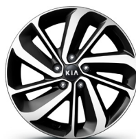
18" Leichtmetall Felgen (Option) Jantes en alliage léger 18" (option) Cerchi in lega leggera 18" (opzione)

KIA Motors AG behält sich das Recht vor, jederzeit und ohne vorherige Ankündigung Ausrüstung und Preise ihrer Modelle zu ändern. Bei den technischen Daten handelt es sich um Werksangaben. Irrtum und Druckfehler vorbehalten.